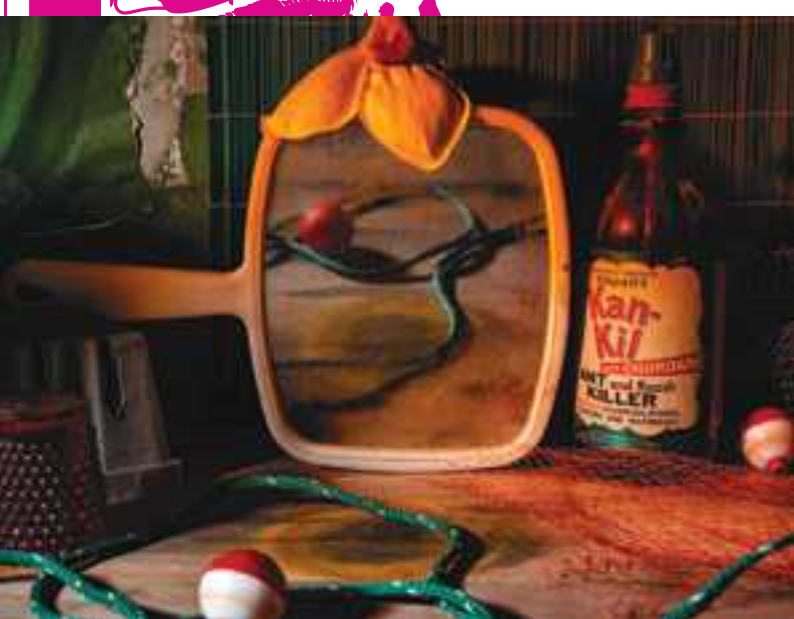
Shelf Still Life (Green &amp; Red), 2019