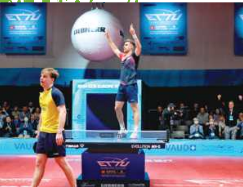
Darko Jorgic, Vainqueur en 2024