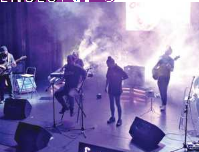
Concert du Band Eben-Hézereen